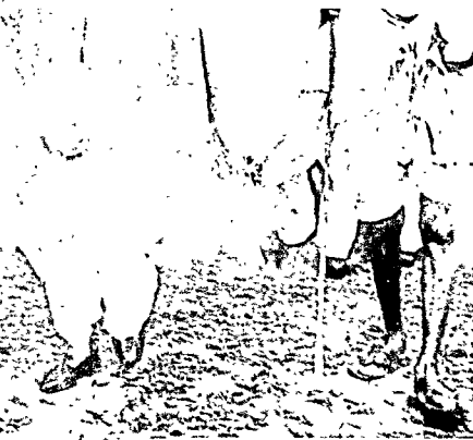
लेखक गांधीजी के साथ